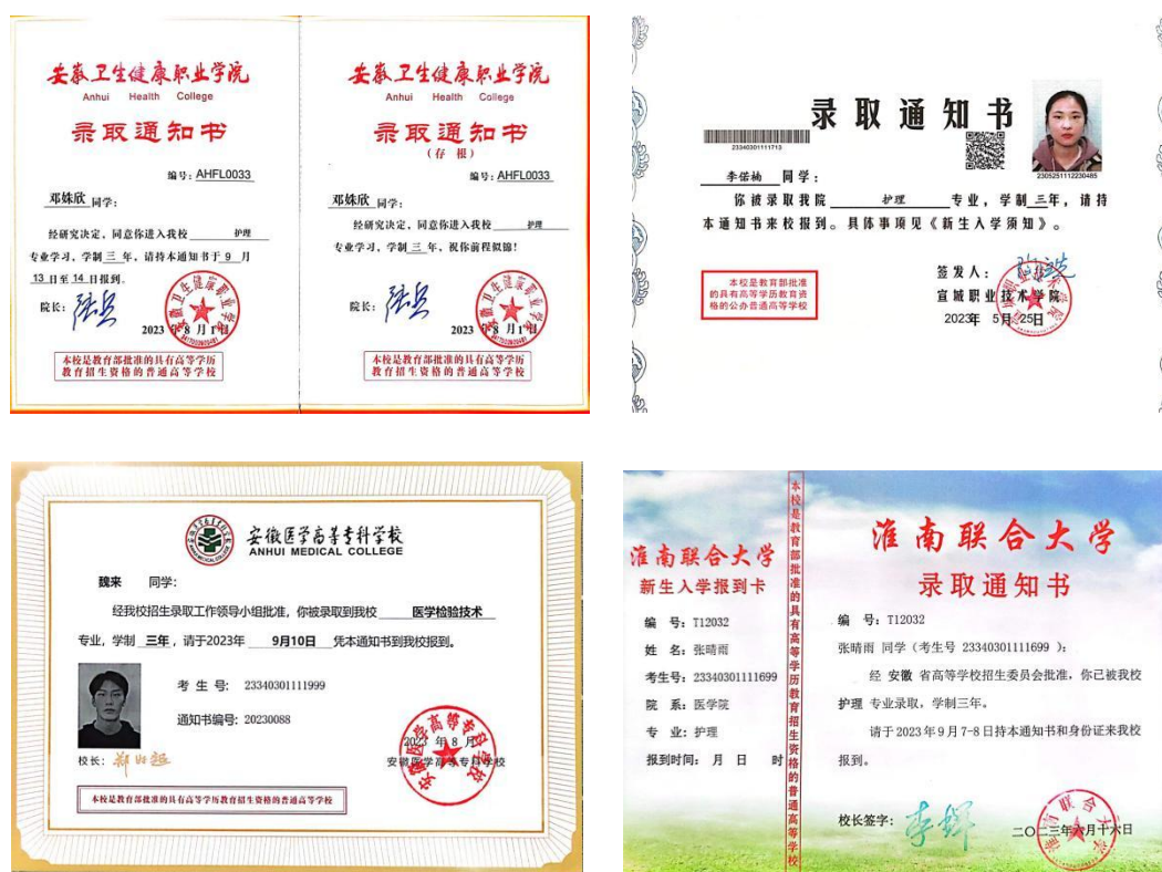
图 5 部分升入高职院校学生录取通知

2023 届毕业生 408 人，就业（含升学）人数 364 人，不就业拟升学 44 人，330 名学生通过分类招生考试升入高职院校继续深造，10 人进入民营医院、乡镇卫生院、养老院和药品销售企业就业，学生对口就业率 83.55%，学生初次就业起薪平均约为 3000 元/月/人。通过对毕业生的跟踪调查，毕业生进入工作单位后在学习能力、岗位适应能力、岗位迁移能力和创新创业能力方面的自我评价较好，高职院校和聘用我校毕业生的民营医院、乡镇卫生院、养老院和药品销售企业等单位对学校毕业生在这些方面的评价较好，这是对学校管理和教育教学水平的肯定。