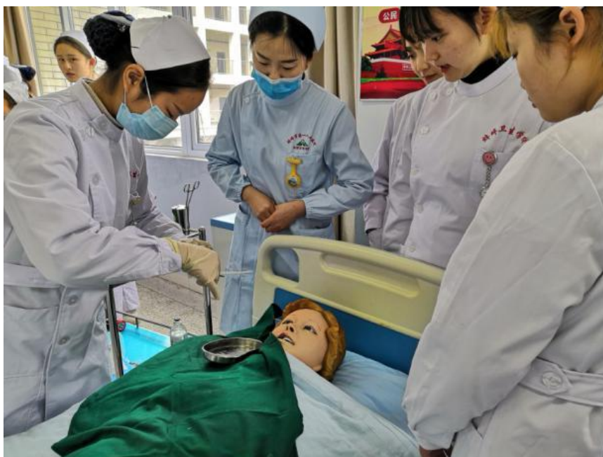
图 9 聘请医院护士长到开展学生实习岗前培训

3.2 课程建设。学校根据教育部办公厅公布的《中等职业学校专业教学标准（试行）》的要求，从培养学生基本文化素质和职业素质出发，确保公共基础课开齐、开足、开好。现在主要开设的公共基础课有德育（职业生涯规划、职业道德与法律、政治经济与社会、哲学与人生）、文化课（语文、数学、英语、计算机应用基础）、体育与健康及选修课；专业课主要选用人民卫生出版社的护理专业和医学检验技术专业的教材。