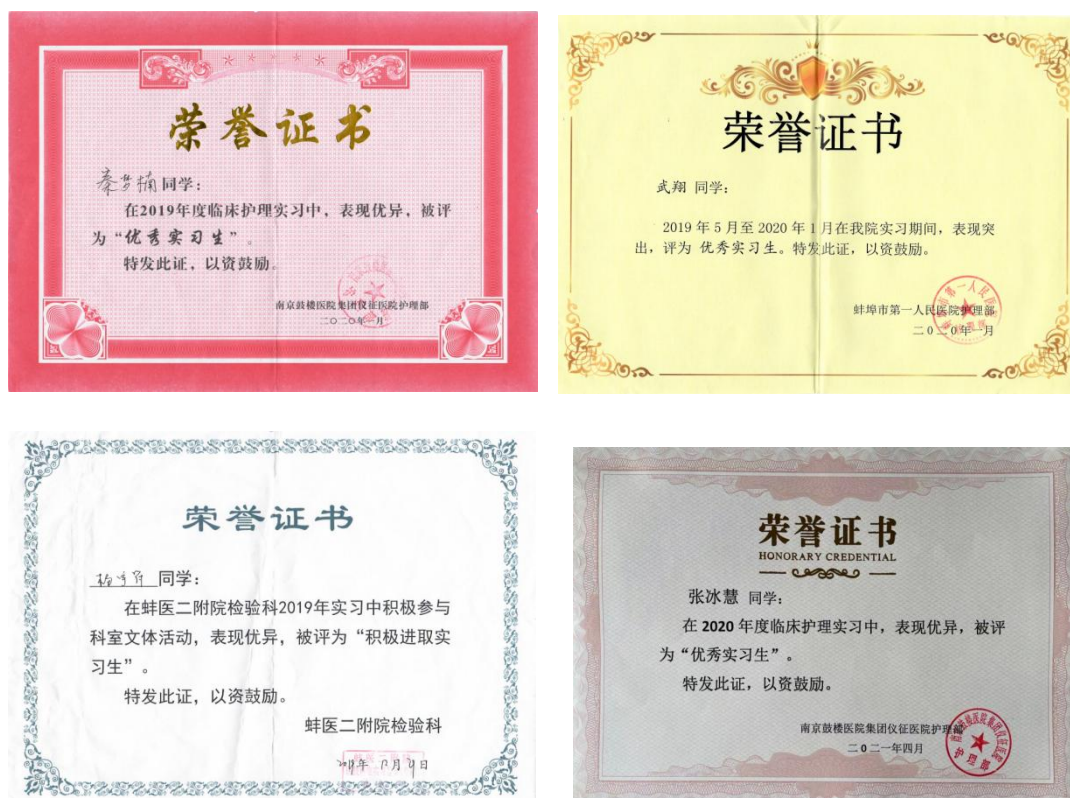
图 18 部分学生获得优秀实习生荣誉证书