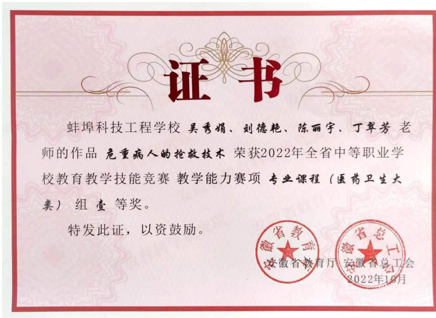
图 11 教师参加全省教师教学能力大赛获得一等奖