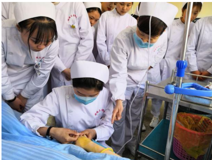
图 8 聘请医院实习带教老师到校指导学生实训

件、稳定并持续扩大招生规模，力争培养更多服务地方医疗卫生事业的专业人才。学校与本市的六家医院和医疗机构建立校企合作关系，聘请市卫计委、蚌埠医学院和各家医院的专家参与学校人才培养方案的制定，学校聘请蚌埠医学院和各家医院的部分教师、护士长到校指导教学、实训、大赛等工作，对学校专业建设和人才培养质量提升起到积极作用。在安徽省中等职业学校质量提升工程建设中，护理专业通过验收，获批省级示范专业。