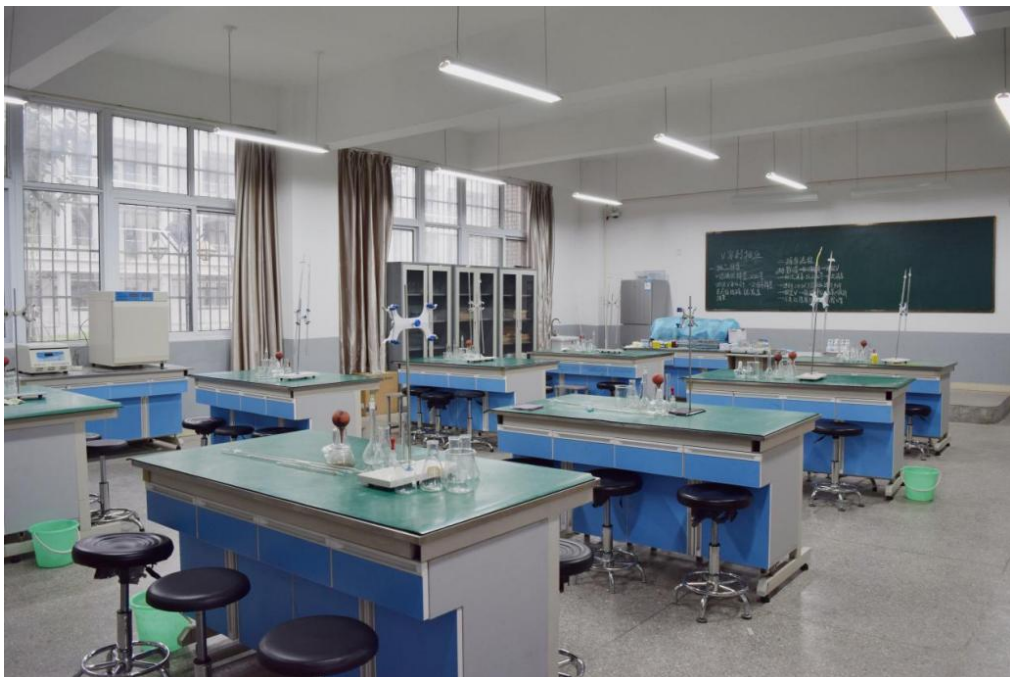
图 3 检验实训室