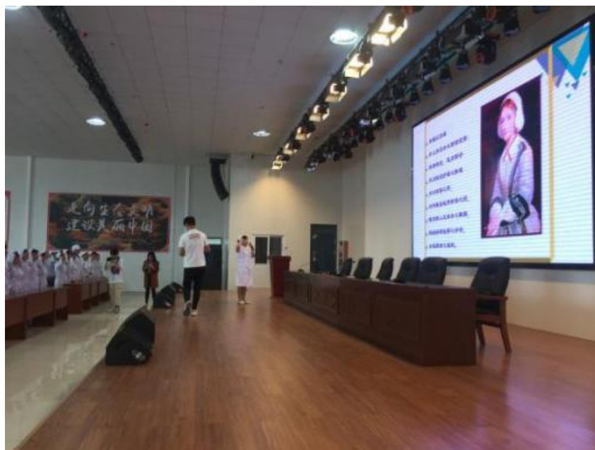
图 13 医护专业学生集体宣誓

进素质教育的要求，以建设优良校风、教风、学风为核心，以丰富多彩、寓教于乐的校园文化活动为载体，积极探索学生管理的新途径、新方法。重点抓好学生“四自”教育：即做人自尊、行为自律、学习自觉、生活自理的养成，在培养人、塑造人上下功夫。组织开展授帽仪式、南丁格尔精神讲座，庆祝“5·12”国际护士节系列活动等，帮助学生树立职业理想，坚定职业选择，教育学生牢固树立“救死扶伤、精益求精”的工匠精神。