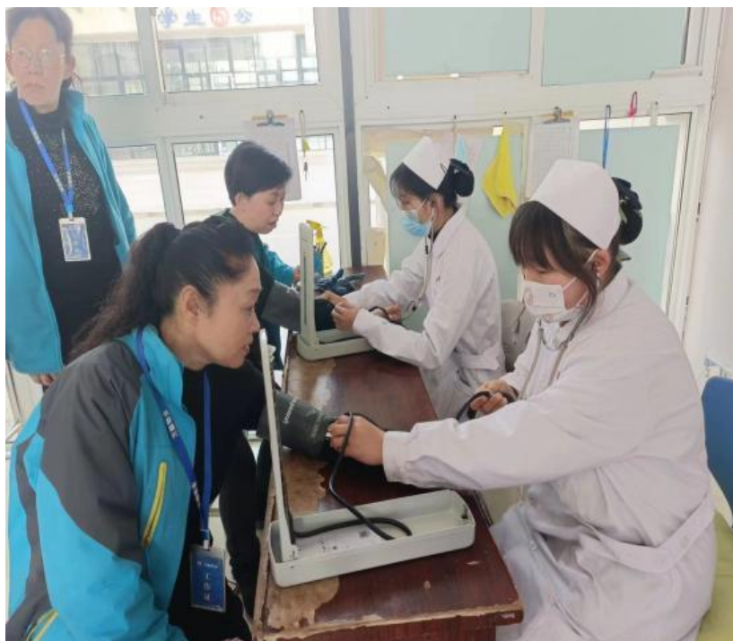
图 23 学生为公寓生活老师测血压