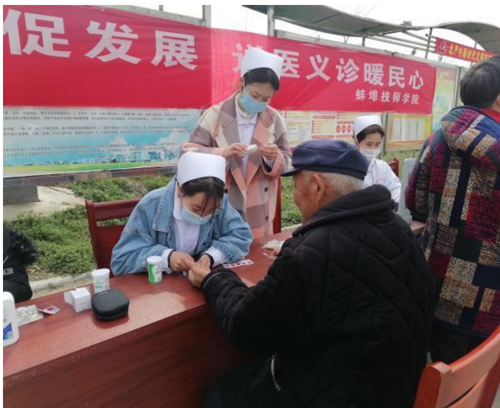
图 20 学生为村民测血糖