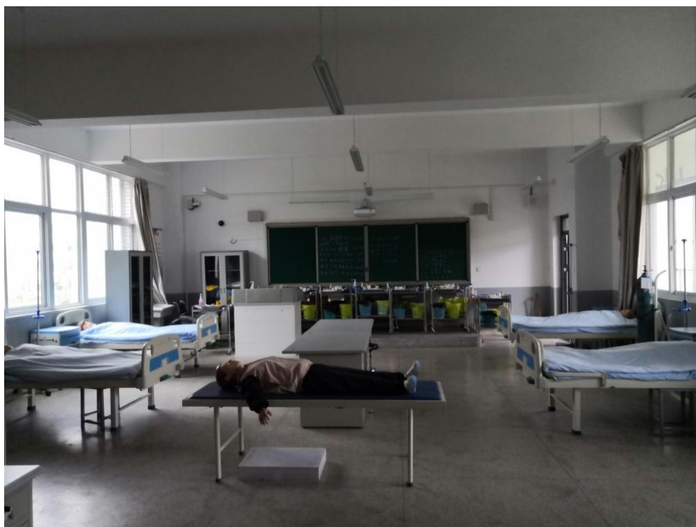
图 1 基础护理实训室

学校现有各类教学用实验实训设备、仪器总值 855.86 万元，生均设备仪器值 0.6 万元。共有 19 个实验实训室，包括：基础护理实训室 4 间、护理示教室 1 间、护理仿真实训室 1 间、护理礼仪实训室 1 间、健康评估实训室 1 间、内科实训室 1 间、外科实训室 1 间、妇科实训室 1 间、儿科实训室 1 间、康复实训室 1 间、检验实训室 1 间、中药实训室 1 间，模型室和计算机机房各 2 间，共有实验实训工位 790 个，生均实验实训工位数为 0.55 个，实验实训室布局合理、工位充足、管理规范，能够满足教学、实训、培训鉴定和市级以上技能竞赛要求。