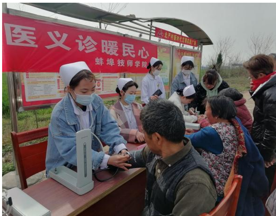
图 21 学生为村民测血压