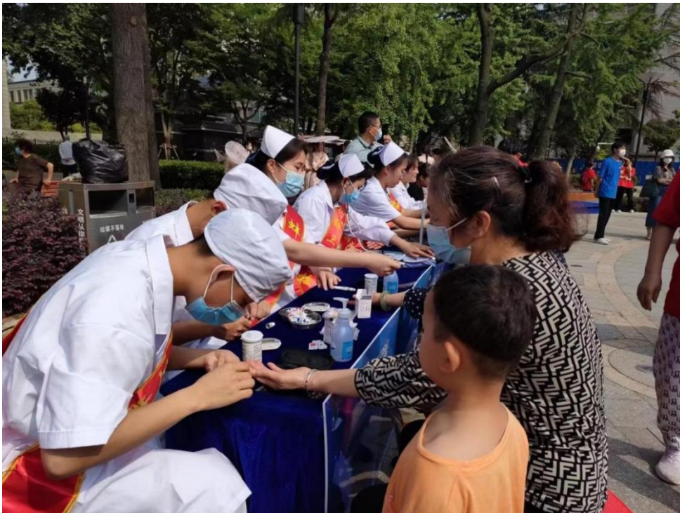
图 27 学生为市民测血糖、测血压

学生通过多次参加志愿服务社会实践，学生体会很深，不仅提升专业技能，还能培养团队合作精神和服务意识。同时学会了倾听、