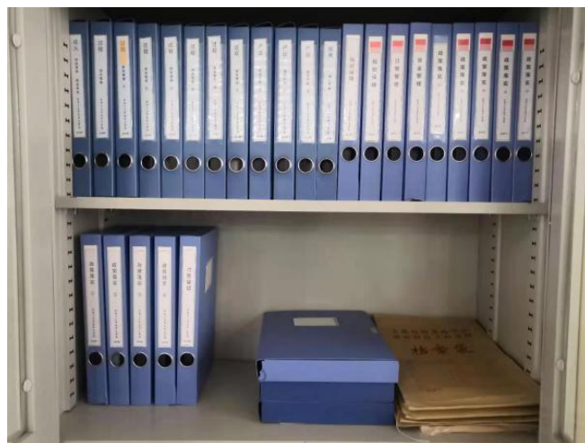
图 30 卫校学生资助档案

学校对于全体学生均不收取学费。免学费资金由中央和地方政府承担。助学资金由市学生资助管理中心统管，免学费资金及时预拨付给学校，我校将上述资金全部用于学校教育教学。国家助学金全部通过学生本人社保卡足额、及时发放给学生。2022-2023 学年中职学校国家奖学金，蚌埠卫生学校 2 人荣获。学校按政策足额提取校内资助金，全部用于学生资助。学校高度重视教育扶贫工作，对建档立卡家庭经济困难学生做到资助全覆盖。学校对孤儿、残疾学生给与特别关怀，将党和政府的关爱送到这些学生心上，使他们安心入学，健康成长。