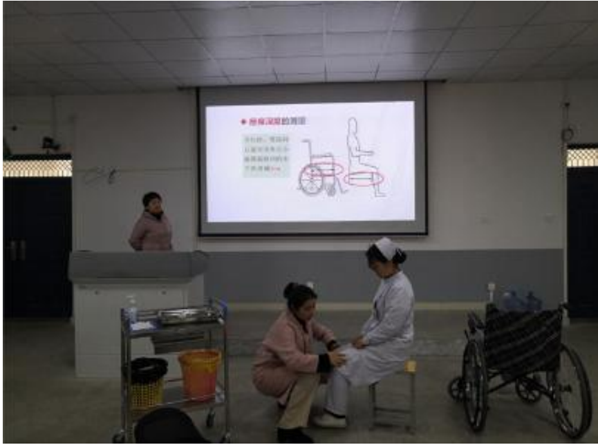
图 10 邀请医院专家来校开展专业技能培训