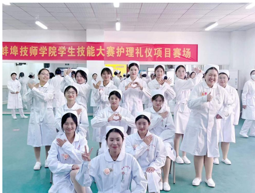
图 14 学生参加护理礼仪大赛