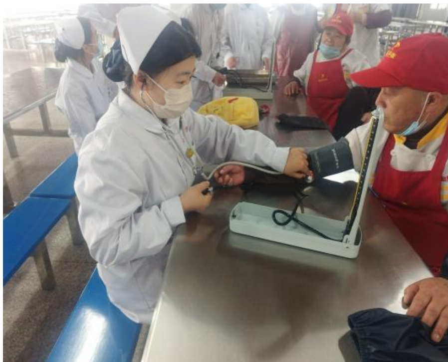
图 22 护理专业学生为食堂工作人员测血压