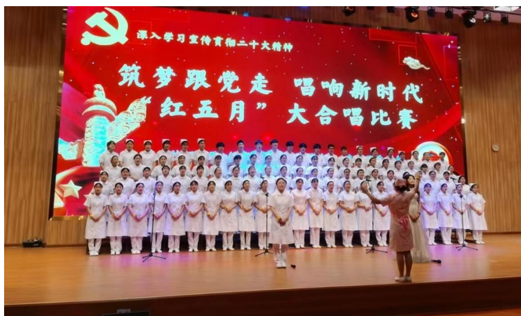
图 15 22 级护理 2、10 班学生参加“红五月”歌咏比赛

学校通过组织每周一次的升旗仪式，国旗下讲话，新生军训、学雷锋活动、争当志愿者献爱心活动，“红五月”歌咏比赛和社会公益活动，做到寓教于乐，不断陶冶学生情操，传承红色基因。