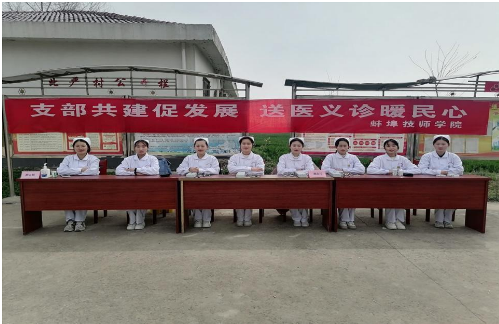
图 19 2023 年 3 月 19 日怀远包集镇北严村志愿服务