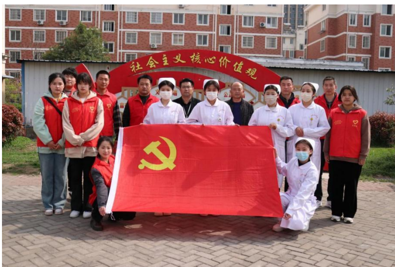
图 24 2023 年 4 月 3 日淮上区荷花园便民活动