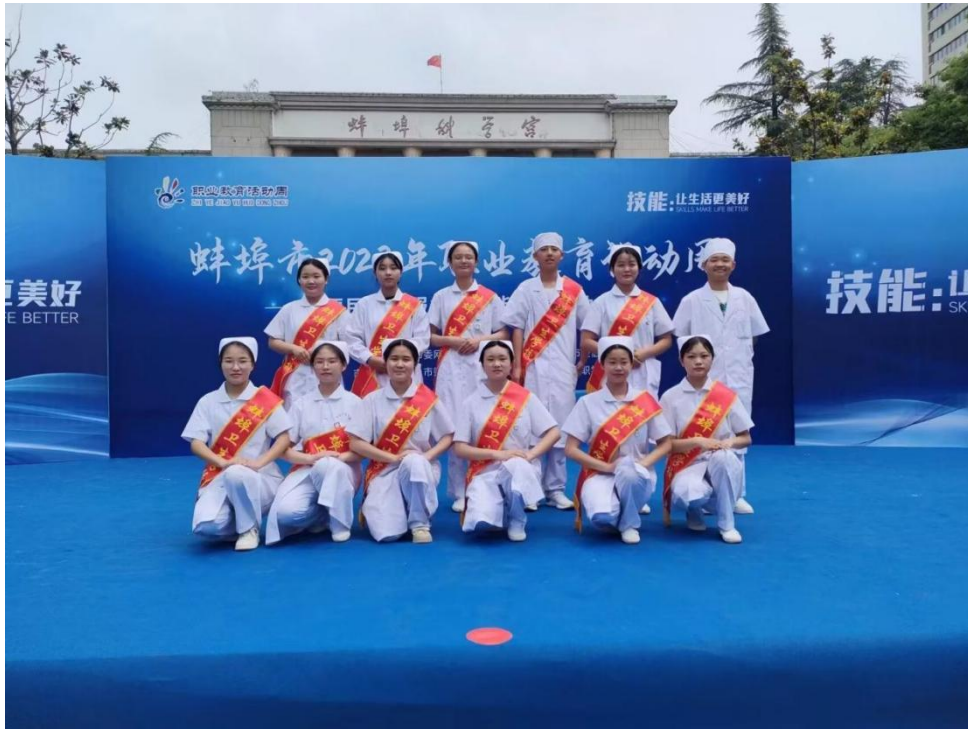
图 26 2023 年 5 月 20 日职业教育宣传周志愿服务