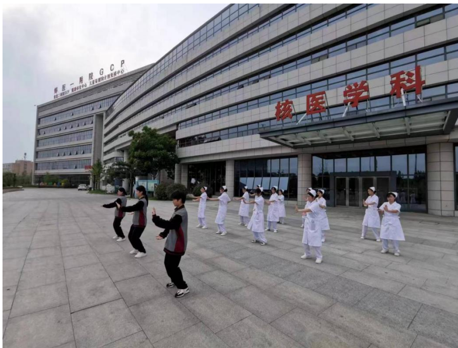
图 16 学生参加“传承中华传统武术文化 八式太极拳的学与练”活动

学校高度重视中华优秀传统文化的教育和传承，通过组织开展中华优秀诗词诵读，中华传统文化知识讲座，中华优秀传统文化读书活动等丰富多彩的活动，教育引导广大学生学习中华优秀传统文化，坚定文化自信。