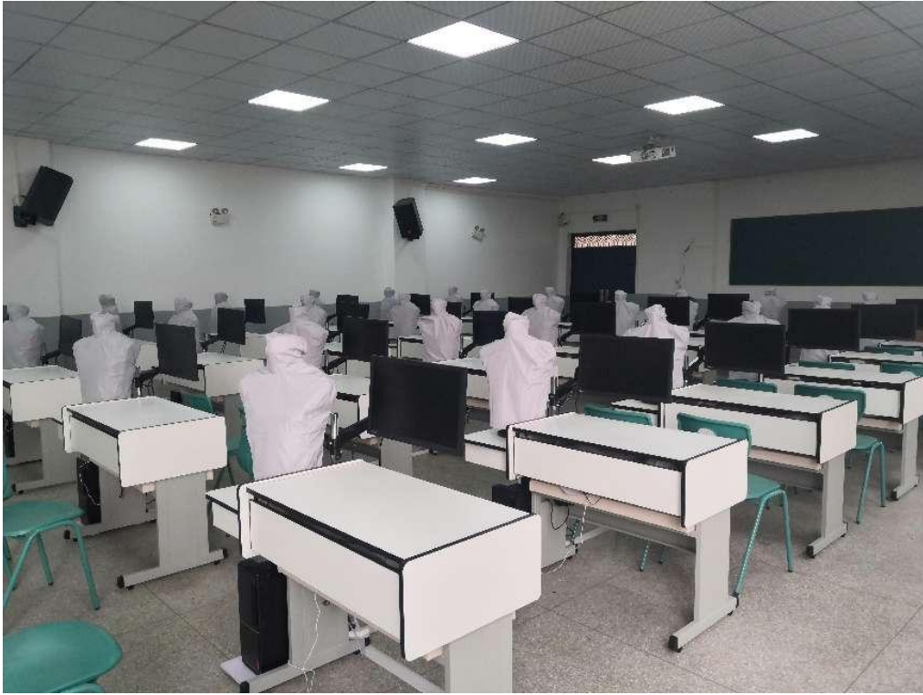
图 2 健康评估实训室