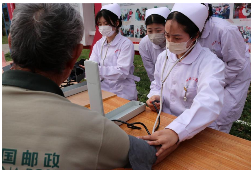
图 25 学生为市民测血压