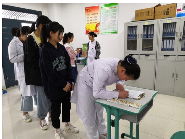
图 31 卫校学生在签领资助银行卡