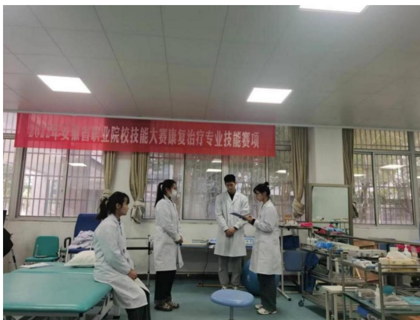
图 12 教师带学生在合肥职业技术学院医学院学习

总之，本次康复技术大赛的外出培训学习观摩操作是一次非常有意义的经历。通过学习和实践，我不仅提高了自身的技能水平，也为学生带来了最新的康复技术技能。在未来的工作中，我将继续学习和探索康复技术，为省级康复技能大赛做好准备。