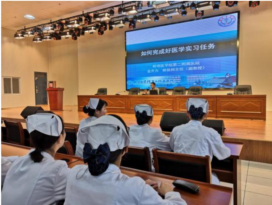
图 17 邀请医院专家来校为实习生开设讲座

到医院临床实践管理办法》等规章制度，邀请上述单位的专家到校讲学指导，促进学校专业教学水平的提高，实现校企合作双元育人。